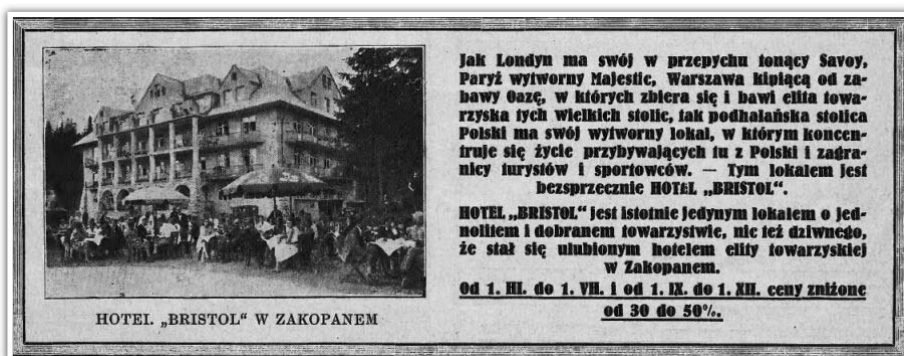
„Echo Zakopiańskie” – 23 lipca 1931 r.