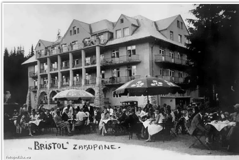
Hotel Bristol – okres międzywojenny (ok. 1931 r.)