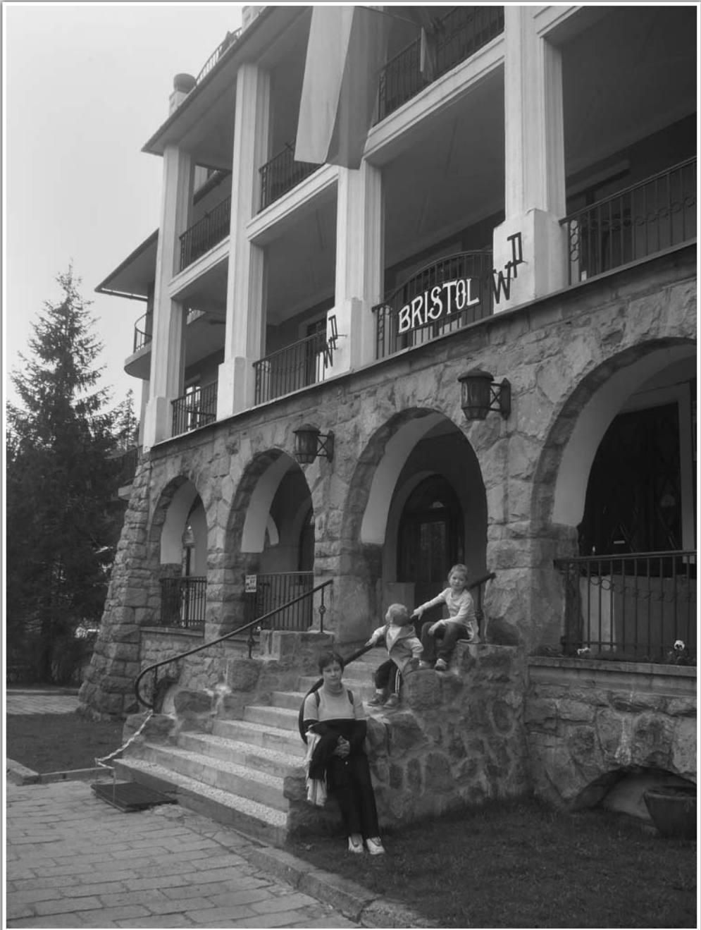
Hotel Bristol w Zakopanem, maj 2010 r.