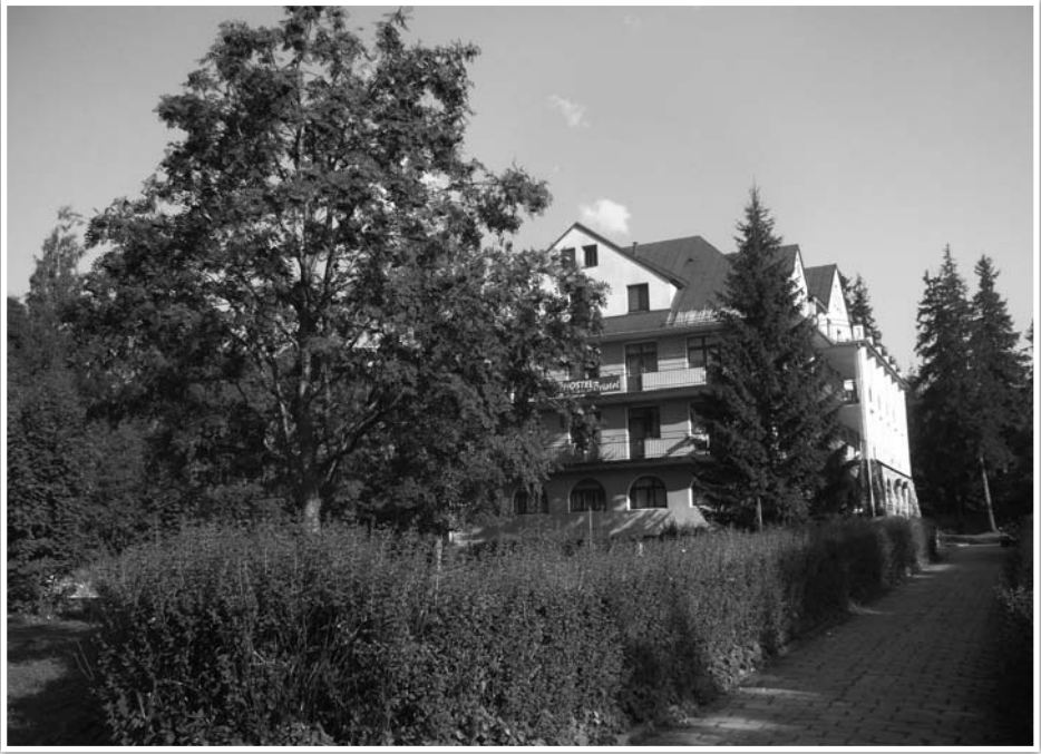
Zakopane – hotel Bristol